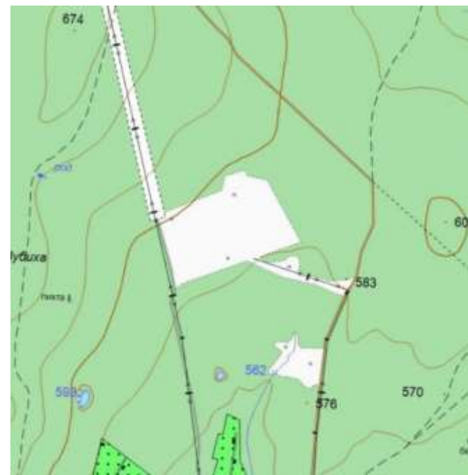
Топографическая съемка, М 1:2500.