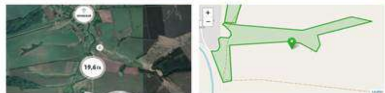
Земельный участок на территории Куркинского района