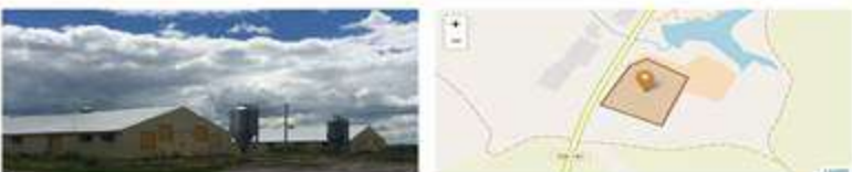
Птицеводческий комплекс ООО СХП "Прогресс"