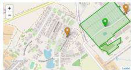
Промышленная площадка бывшего спиртзавода