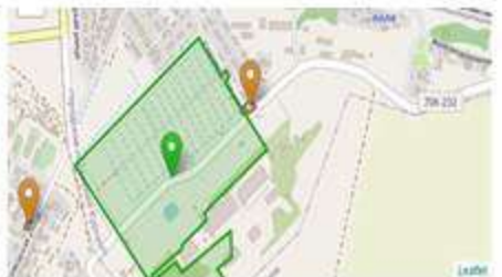
Промышленная площадка бывшего сахарного завода